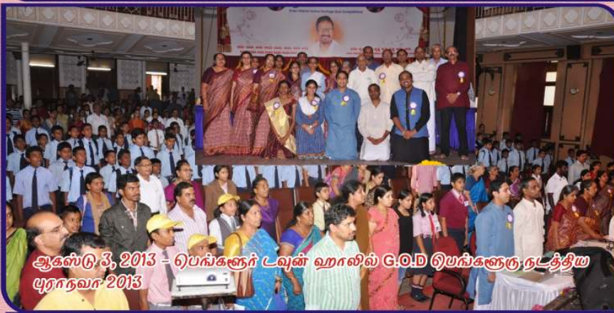
ஆகஸ்டு 3, 2013 - பெங்களூர் டவுன் ஹாலில் G.O.D பெங்களூரு நடத்திய புராதனம் 2013