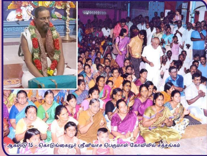
ஆகஸ்டு 15 - கொடுங்கையூர் ஸ்ரீனிவாச பெருமாள் கோவிலில் சத்தன்கம்