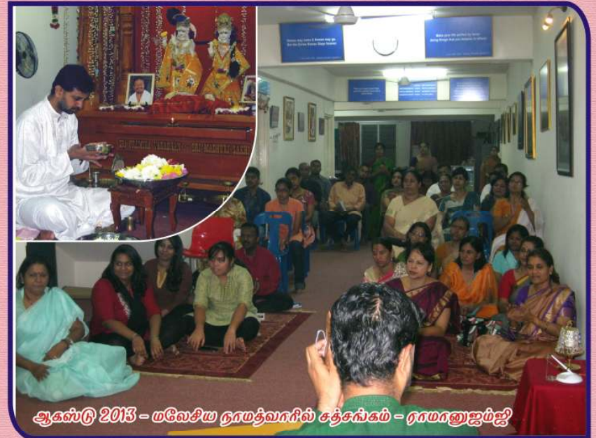
ஆகஸ்டு 2013 - மலேசிய நாமத்வாரில் சத்சகம் - ராமானுஜம்ஜீ