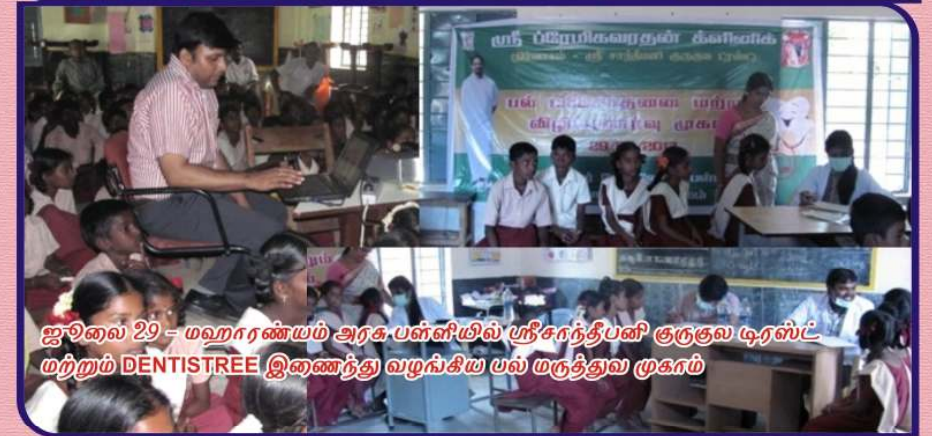
ஜூலை 29 - மஹாரண்யம் அரசு பள்ளியில் ஸ்ரீசுந்தர்பனி குருகுல டிரஸ்ட் மற்றும் DENTISTREE இணைந்து வழங்கிய பல் மருத்துவ முகாம்