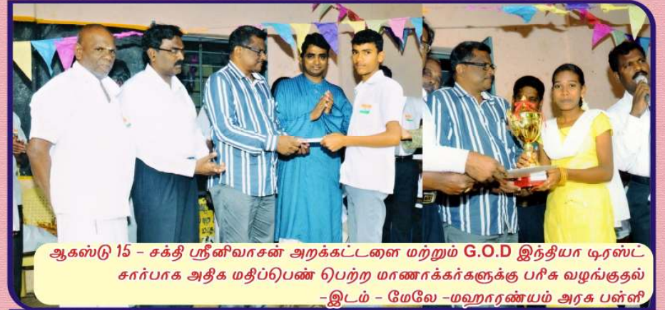
ஆகஸ்டு 15 - சக்தி ஸ்ரீனிவாசன் அறக்கட்டளை மற்றும் G.O.D இந்தியா டிரஸ்ட் சார்பாக அதிக மதிப்பெண் பெற்ற மாணாக்கர்களுக்கு பரிசு வழங்குதல் -இடம் - மேலே -மஹாரண்யம் அரசு பள்ளி