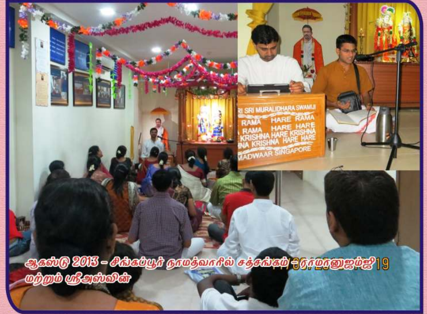
ஆகஸ்டு 2013 - சிங்கப்பூர் நாமத்வாரில் சத்சகம் பிரம்மனுஜம்ஜீ 19 மற்றும் ஸ்ரீஅஸ்வினி