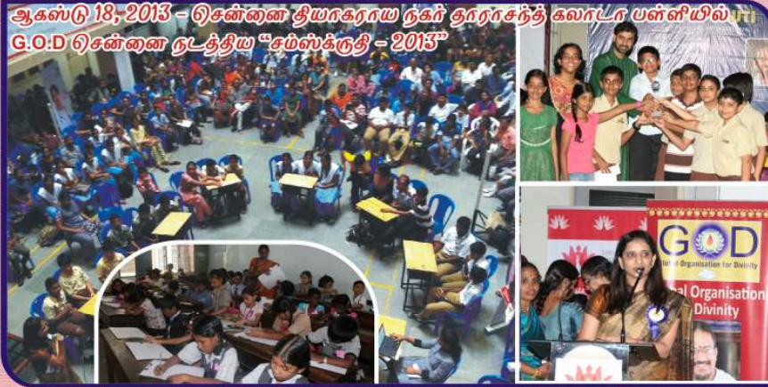
ஆகஸ்டு 18, 2013 - சென்னை தியாகராய நகர் திரைப்படக் கலாடா பள்ளியில் G.O.D சென்னை நடத்திய "சம்ஸ்கிருதி - 2013"