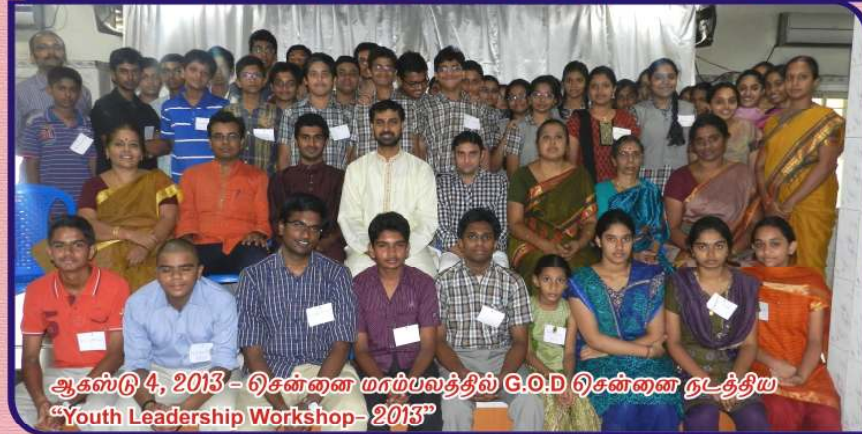
ஆகஸ்டு 4, 2013 - சென்னை மாம்பலத்தில் G.O.D சென்னை நடத்திய "Youth Leadership Workshop - 2013"